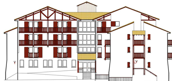
Relevé de façades intégralement réalisé à l'aide du SCANNER 3D

Les façades de l'immeuble ci contre ont pu être livrées une semaine après la commande.