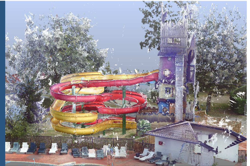
Toboggan aquatique dans un camping sur la Commune de Leon (40)

ARGEO est en mesure de vous assister dans la représentation des structures les plus complexes.