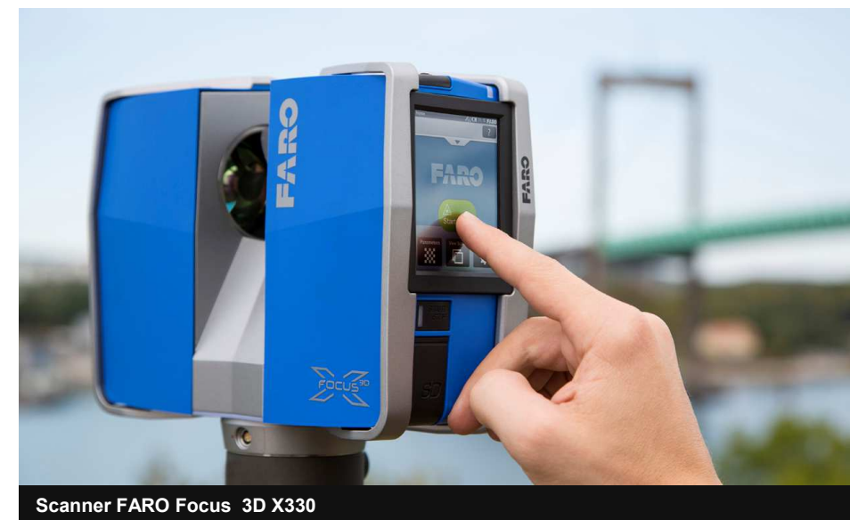
Scanner FARO Focus 3D X330

« Un outil aujourd'hui indispensable, l'avenir d'une profession »